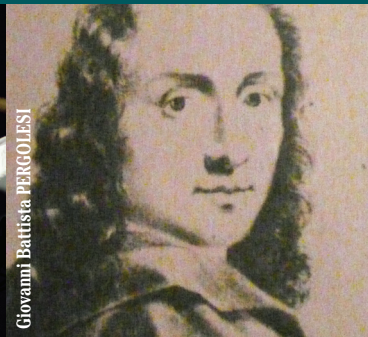
Giovanni Battista PERGOLESI