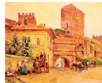
Porta S. Lorenzo (particolare dell'acquerello della serie Roma Sparita: non lontano da qui partiva la tramvia a vapore per Tivoli - dal 1879)