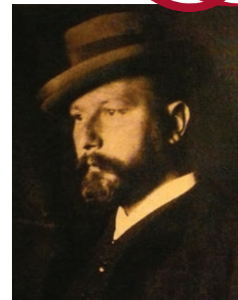
Fotoritratto di E.R.Franz (dal volume: Roma fine secolo nelle fotografie di E.R.Franz ed. Quasar - Roma, 1978)