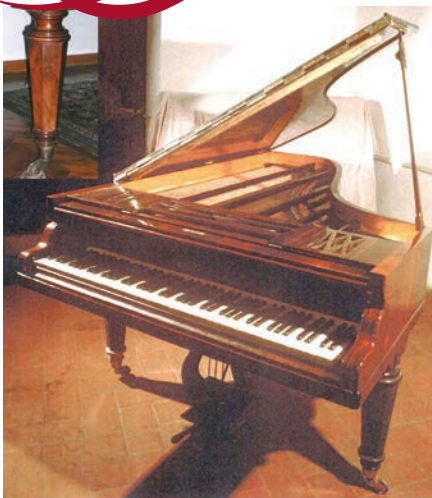
Il coda (210cm) appartenuto a Liszt a Villa d'Este (con particolare della gamba)