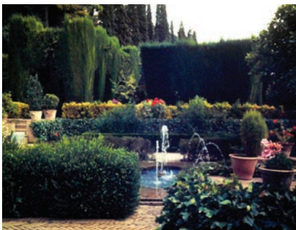
Giardini del Generalife a Granada: una scala con i mancorrenti percorsi dall'acqua e uno degli ambienti delimitati da alte siepi e attiguo al cosiddetto "cortile dei cipressi"