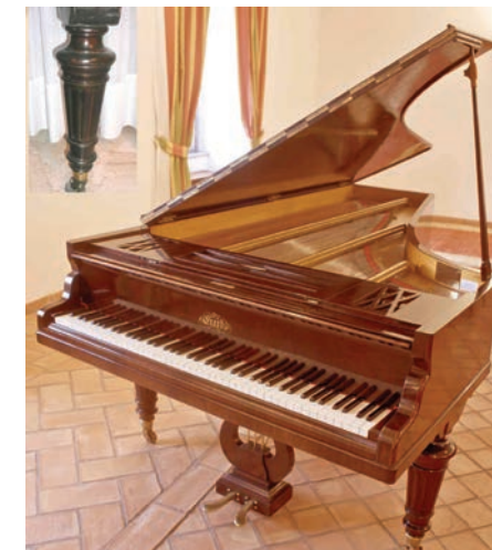
Il gran coda (247cm) del 1879 usato nei concerti (con particolare della gamba)