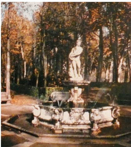
Uno scorcio dei Giardini di Aranjuez con la Fontana di Apollo